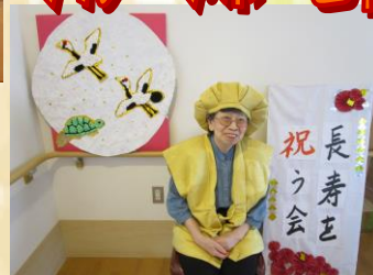
口紅も塗ってお澄まし顔でポーズ♪