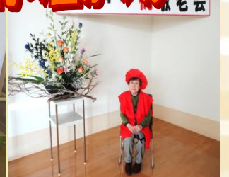
ご家族から頂いたお祝いのお花と一緒に・・・