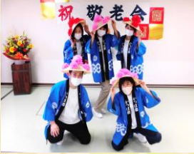
職員による花笠音頭♪来年は私たちも踊ります！