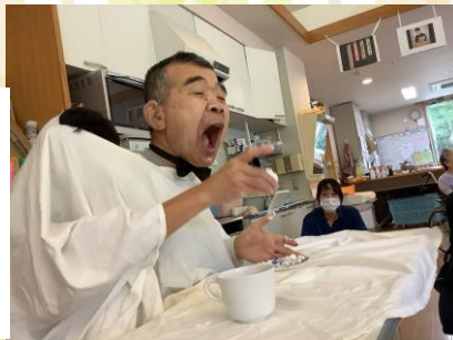
クリームたっぷりつけて・・・二人羽織。いただきまーす♪