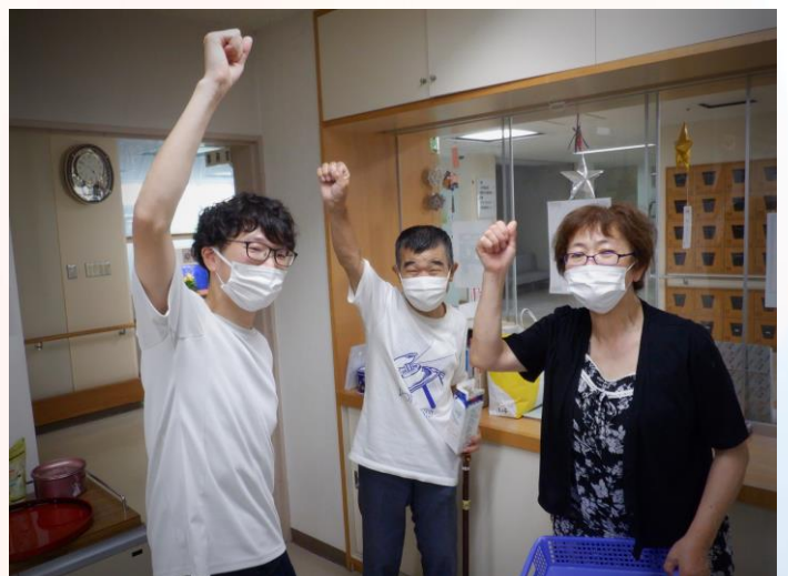
全部売れた！！やったー！

豆の膨らみ具合を日々確認し、長年畑をしてきたベテラン奥様たちの「Ok」を頂き、「今日は枝豆収穫祭で～す！」と待ちに待った日を迎えました。午前中からせつせと豆もぎ作業をし、お昼で茹でて食べて、夕食でも食べて・・・それでも大量にある豆たちです。「移動販売しよう」と、新聞紙で袋を手作りし、豆を詰め、事務所や支援センターへ販売に行きました。おかげさまで2回ともめでたく『完売』🍵 こっそりおまけしてくれる売り娘さんですが、商売上手ですね(笑) 枝豆の季節が終わり、今は大根たちが芽を伸ばし始めています。この冬は「ふろふき大根」やら「おでん」やら・・・1品追加の大根料理が毎日!! 並びそうな予感です。お楽しみに!