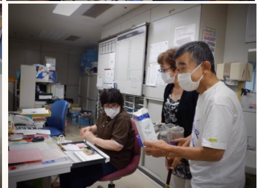
「枝豆どうですかー?」「美味しいよー」「おまけしますよ～」